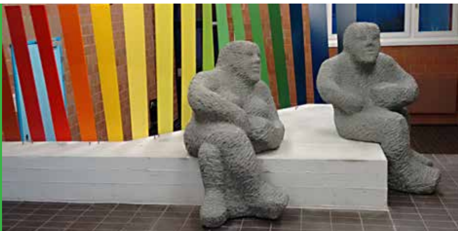
[ Ruedi Mösch, „Kommunizierendes Paar“, 2015, (LxBxH) 400 x 200 x 150 cm, Sandstein, Eisen lackiert, Betonsockel ]