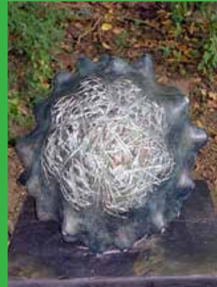
[ Line Lindgren ]