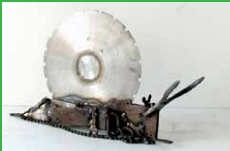
[ MERESK ]