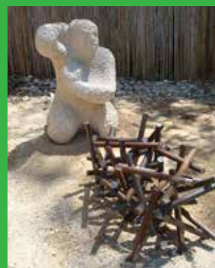
[ Ruedi Mösch ]