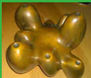
[ Line Lindgren ]