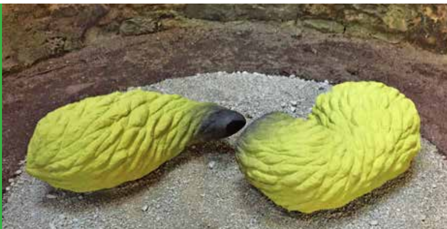
[ Claudia Dietz, „kleine Krümmertierchen“, 2015, (LxBxH) je 70 x 35 x 45 cm, Sandstein, Farbe]

Lageplan auch unter: http://map.search.ch/d/deztrlnj