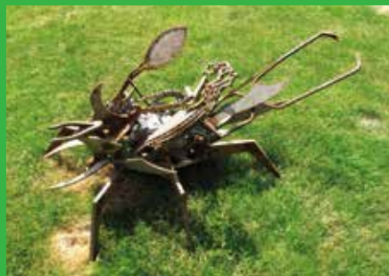
[ MERESK ]